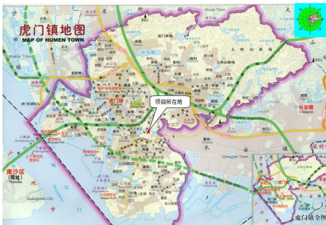
图 3-1 厂区地理位置图

东莞市合中川电子科技有限公司位于广东省东莞市虎门镇小南工业一路2号(地理坐标:北纬 22^{\circ}48'6.83'' ,东经 113^{\circ}41'33.09'' ),地理位置见图3-1,厂区平面布置及监测点位图见图3-2。